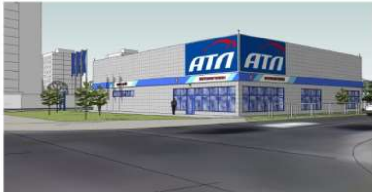
Вид з вулиці Василя Сухомлинського в бік проспекту (зупинка громадського транспорту).